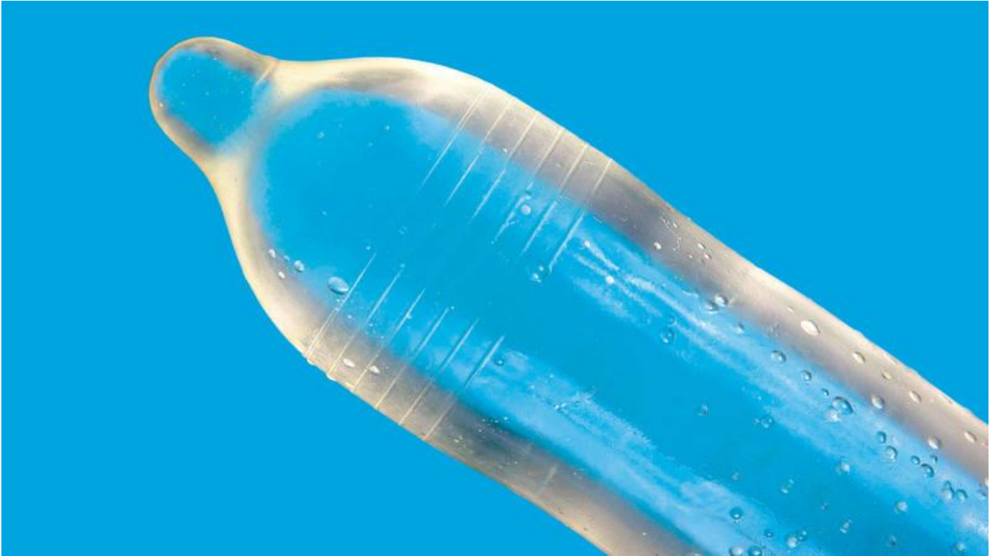
Condón autolubricante.

Este efecto lo obtuvieron con base en la aplicación de polímeros sobre la superficie de látex o poliuretano con el que elaboran los condones actuales. Se considera que para el año 2020 estarán a la venta.